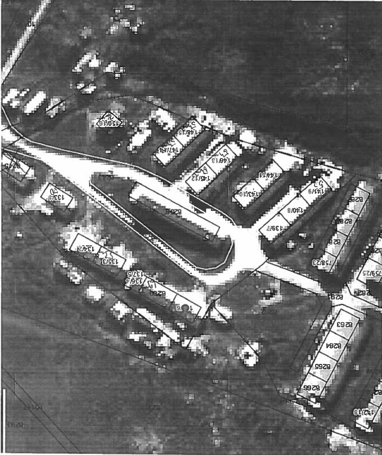
Košický kraj > Gelnica > Nálepkovo > k.ú. Nálepkovo